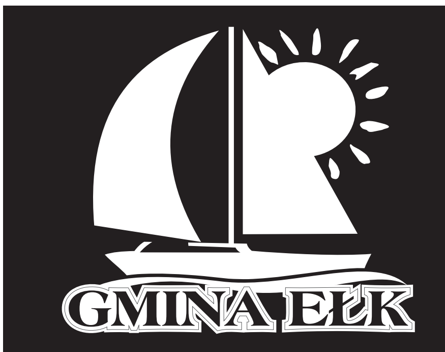
wersja achromatyczna negatywowa

Wersja achromatyczna znaku stosowana jest w przypadku gdy niemożliwe jest odwzorowanie znaku w pełnej kolorystyce oraz w półtonach czerni np.: prasa codzienna, pieczętki, faks. Na ciemne tła stosuje się wersję negatywową znaku.