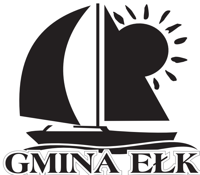
wersja achromatyczna pozytywowa